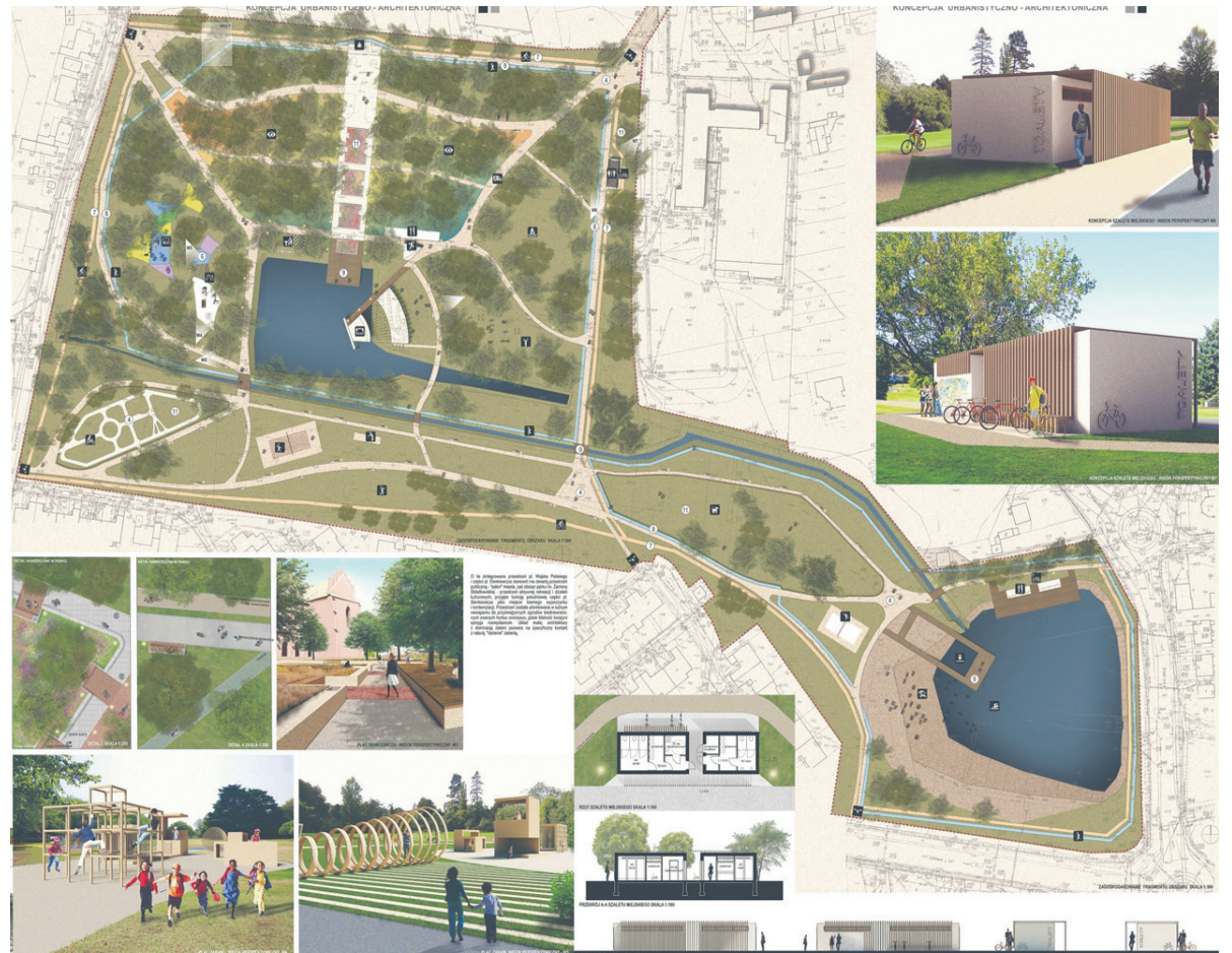
Koncepcja rewitalizacji parku

Odnawiane jest około 11 ha terenów parkowych. W ramach prac zagospodarowana zostanie zieleń parkowa, w tym nowe nasadzenia drzew, trawniki i łąki. Zmodernizowana i przebudowana będzie gospodarka wodna, tj. stawy, cieki i zastawki, m.in. poprzez doprowadzenie rurocią-