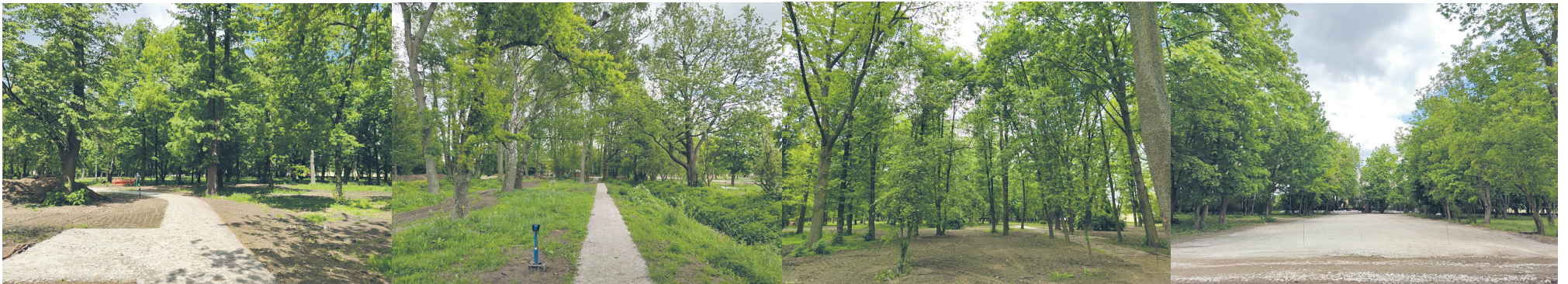
Park Miejski im. Żerminy Składkowskiej w trakcie rewitalizacji

czono, zbadano i opisano każde z 1276 drzew w parku, każdy krzew i żywopłot. Rok później Urząd Miejski w Turku złożył w Urzędzie Marszał-