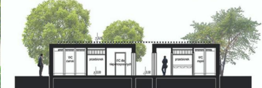
PRZESZKÓJ A-A SZALETU MIEJSKIEGO SKALA 1:100