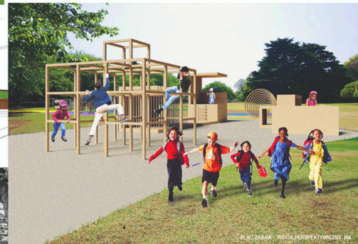
PLAC ZABAW - WIDOK PERSPEKTYWICZNY W4