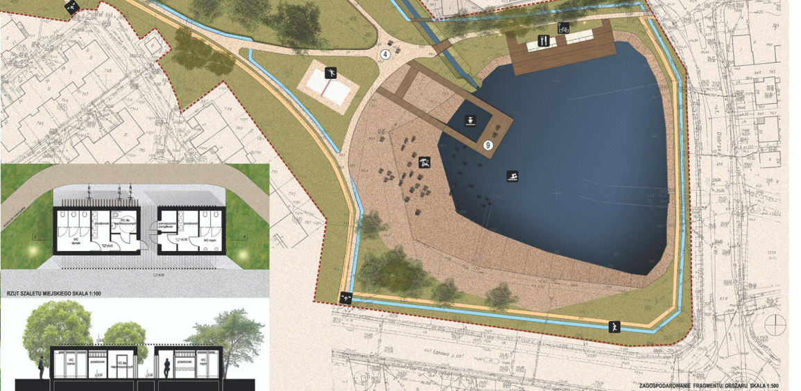
RZUT SZALETU MIEJSKIEGO SKALA 1:100

O ile zintegrowana przestrzeń pl. Włókna Polskiego i części pl. Siemkiewicza stanowiła dla obszaru przestrzeń publiczną "sąsiedzi" miasta, zaś obszar parku (pl. Siemkiewicza) - przestrzeń aktywnej rekreacji i działań kulturalnych, przyjęto funkcjonalną koncepcję pl. Siemkiewicza jako miejsca biernego wypoczynku i kontemplacji. Proponowana koncepcja urbanistyczna nawiązuje do przylegających ogrodów średnio-wiekowych awaryjnych fortów, zachowując jednocześnie swobodę sprężyny kompozycyjnej. Układ małej architektury z dominacją białego powołuje na specyficzną korektę z naturalną "kolorem" zieleni.