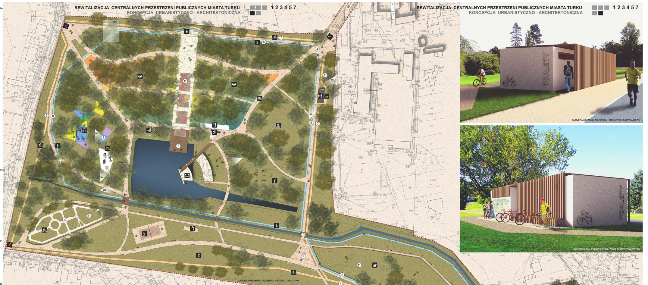
ZAGOSPODAROWANIE FRAGMENTU OBSZARU SKALA 1:500