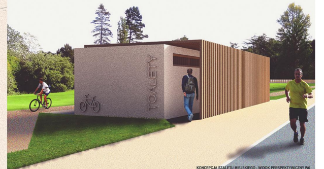
KONCEPCJA SZALETU MIEJSKIEGO - WIDOK PERSPEKTYWICZNY W6