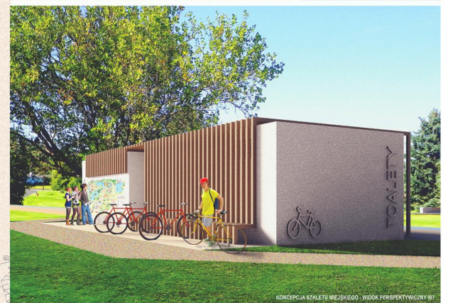
KONCEPCJA SZALETU MIEJSKIEGO - WIDOK PERSPEKTYWICZNY W7