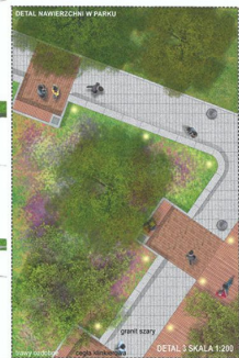
DETAL NAWIERZCHNI W PARKU