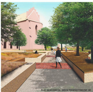
PLAC SIENKIEWICZA - WIDOK PERSPEKTYWICZNY W3

O ile zintegrowana przestrzeń pl. Włókna Polskiego i części pl. Siemkiewicza stanowiła dla obszaru przestrzeń publiczną "sąsiedzi" miasta, zaś obszar parku (pl. Siemkiewicza) - przestrzeń aktywnej rekreacji i działań kulturalnych, przyjęto funkcjonalną koncepcję pl. Siemkiewicza jako miejsca biernego wypoczynku i kontemplacji. Proponowana koncepcja urbanistyczna nawiązuje do przylegających ogrodów średnio-wiekowych awaryjnych fortów, zachowując jednocześnie swobodę sprężyny kompozycyjnej. Układ małej architektury z dominacją białego powołuje na specyficzną korektę z naturalną "kolorem" zieleni.