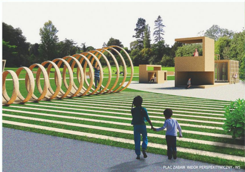
PLAC ZABAW - WIDOK PERSPEKTYWICZNY W5